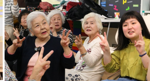
チームワンダフルです♪

最近気温の変化が激しく、就職活動中の4回生は、スーツで出歩くことが辛くなってきました。みなさまも暑くなってきますが、これからも体調にはきをつけて下さいね！来月もお会いできることを楽しみにしております♪(かえきこ)